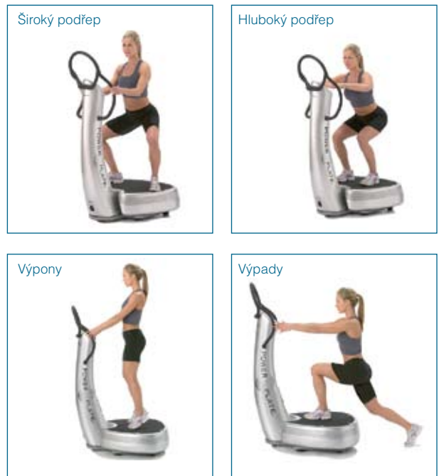
Obr. 1 Příklady Power Plate cviků

skupin: Power Plate® skupina, fitness skupina a kontrolní skupina (necvičící). Skupina Power Plate® a fitness skupina cvičila třikrát týdně po dobu jednoho roku. Power Plate® skupina cvičila pokaždé maximálně 40 minut, zatímco skupina fitness 90 minut. Program fitness obsahoval kardio, cviky s odporem, cviky na podporu rovnováhy a pohyblivosti. Kontrolní skupina měla pokračovat ve svém stávajícím životním stylu.